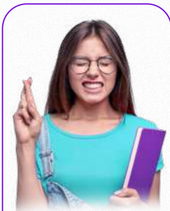
Nota do ENEM